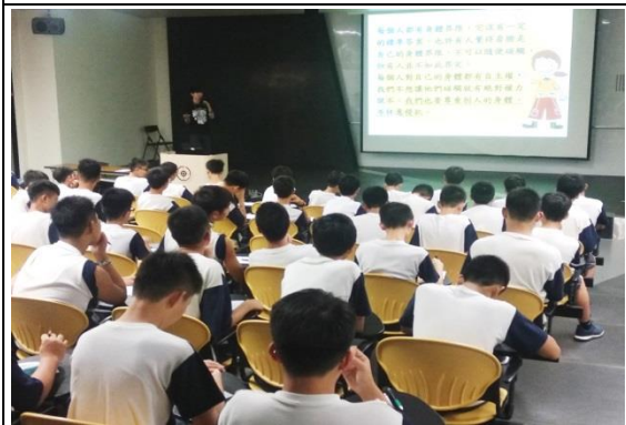
夜間性平團輔(國二男)