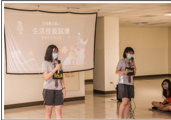
生活技能試煉解說