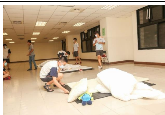
生活技能競賽—棉被摺疊