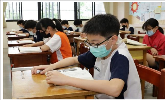
國文課程：獻給家人的一首詩