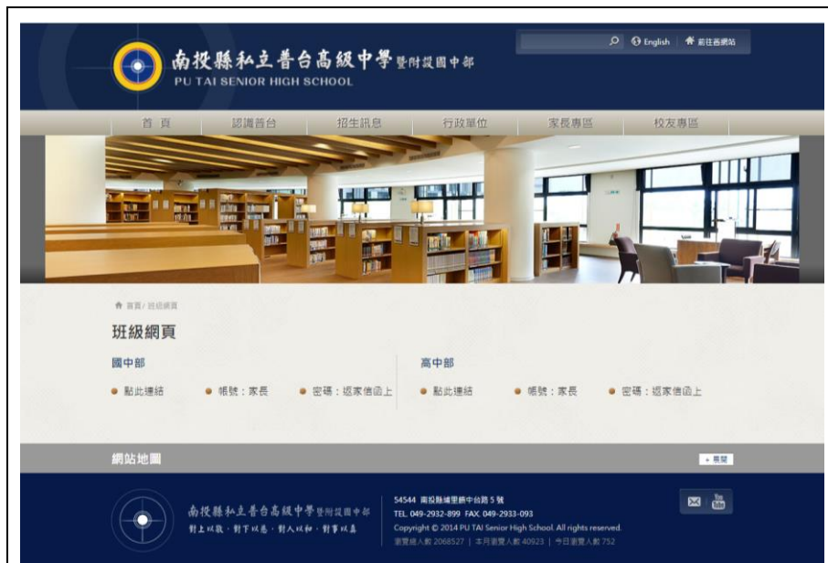
108 學年度國中班級網頁