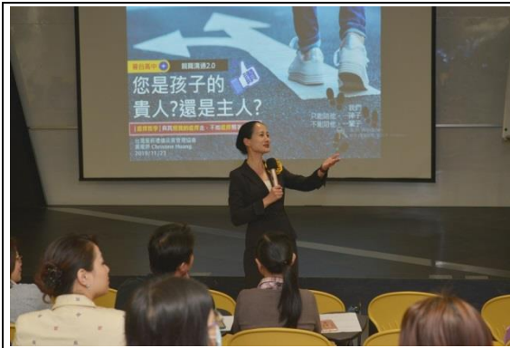
第一場-您是孩子的貴人還是主人?