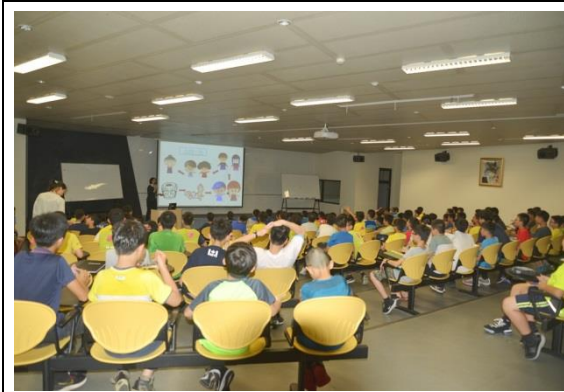
夜間性平團輔(國一男)