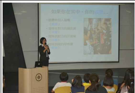
夜間性平團輔(國一女)