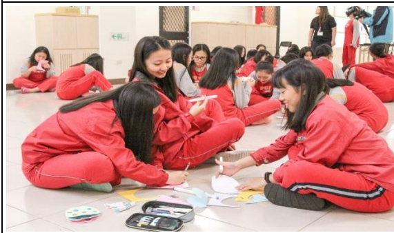
手作課程：母親節卡片製作