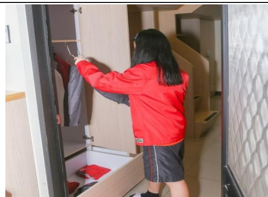
生活技能-衣櫃整理