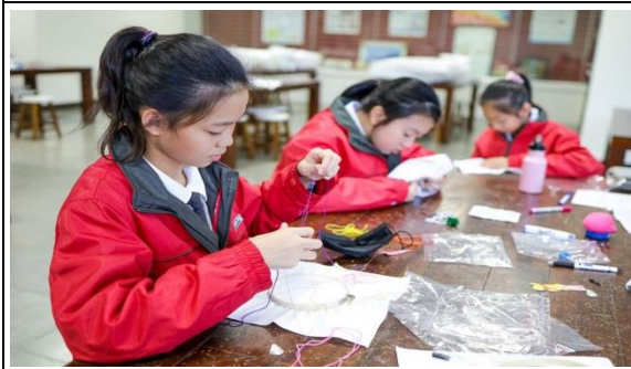
手作課程：愛的獻禮