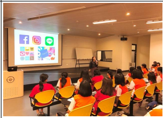
夜間性平團輔(國三女)