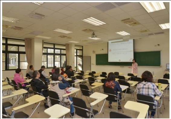
第二場-幫助孩子做自己的主人