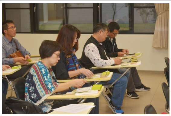
第二場-幫助孩子做自己的主人