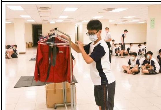
生活技能競賽—衣物擺放