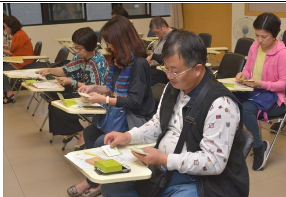
第二場-幫助孩子做自己的主人