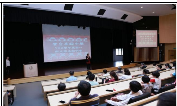
國一新生家長歡迎會