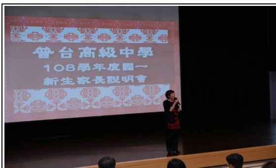
國一新生家長歡迎會

* 運用家長歡迎會、親師座談會校務說明時間與升學說明會時間，由各處室主任進行主題宣導與資訊提供。