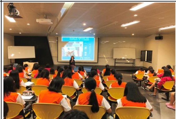
夜間性平團輔(國二女)