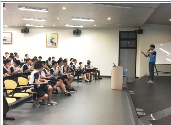
夜間性平團輔(國三男)