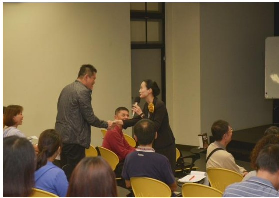
第一場-您是孩子的貴人還是主人?