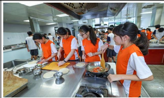
家政課程：一日廚師