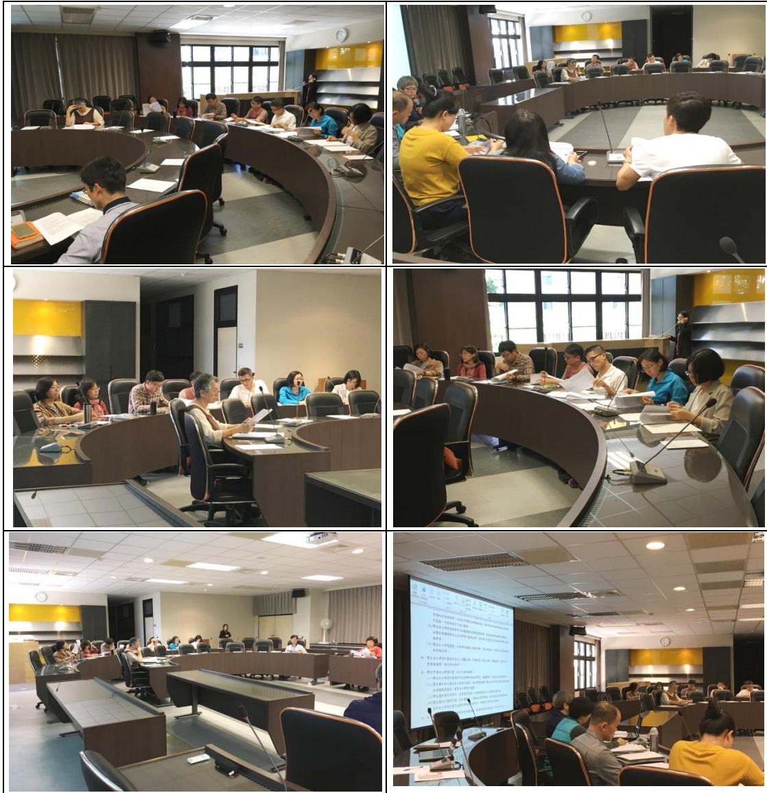
普台高中 108 學年度「各科領域會議」照片