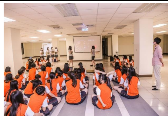
生活技能試煉解說